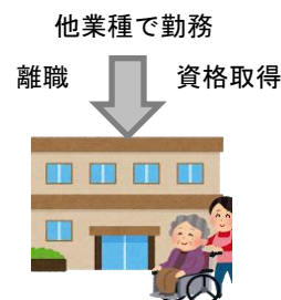
介護保険の居宅・施設サービスに介護職として就職