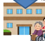
介護保険の居宅・施設サービス