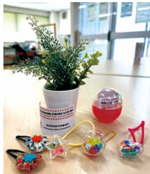
当事者が作成した手芸作品が共同募金のカチャガチャの景品に(泉佐野市)