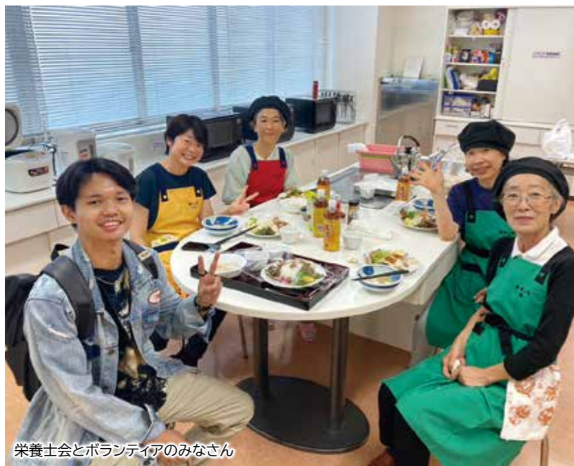
栄養士とボランティアのみなさん