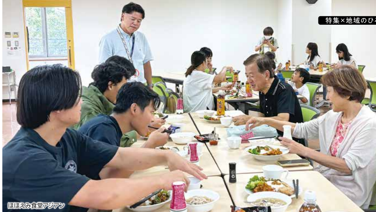
ほほえみ食堂アジア

調理は栄養士会に協力を依頼し、社協のフードドライブの食料や、他団体からの助成金を活用するなど、これまでのつながりや資源を生かし、力を結集してすすめています。西井さんが支援した親子も参加し、外国籍の方も