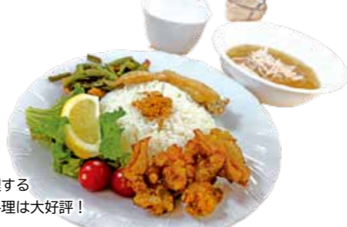
栄養士が調理する インドネシア料理は大好評！

で働くインドネシア出身の職員が孤立している状況を聞き、ほかにも孤立している外国籍の方がいるのではという課題意識から、その方達も地域の親子もみんなが参加できる食堂をつくりました。