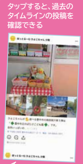
タップすると、過去のタイムラインの投稿を確認できる

「コロナ禍で、0〜1歳対象の子育てサロン」はつとるーむひよこちゃん少路」は、参集での開催を中止。もともとサロンに参加していた家庭には、手紙で気にかけていることを伝え、何かあれば連絡するよう案内していました。