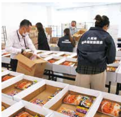
関係者による詰め作業の様子