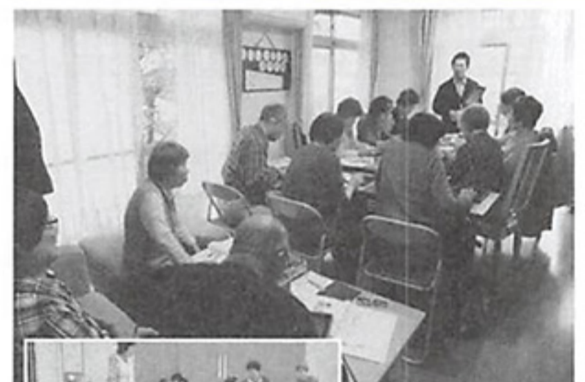
▲砂川サロン いこいの様子