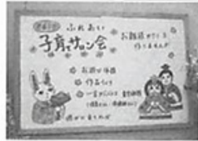
◀子育てサロン会案内板

平成29年度からは、新たに2つの拠点で、おやつづくりや簡単遊びなどをする「子どもサロン会」の実施を計画中です。