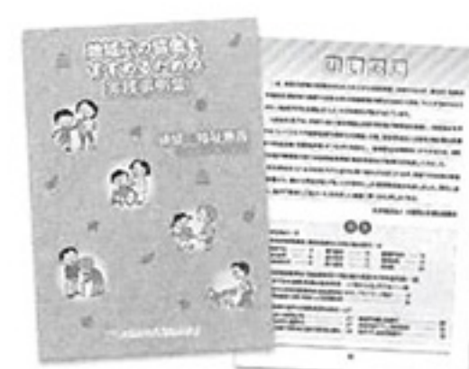
実践事例集の作成には、一般財団法人 高津成和会の助成金を活用しています。

ど、これから施設連絡会を結成、活動の充実を図っていく市町村にとって参考になる内容が盛りだくさんです。 実践事例集の内容は府社協・地域福祉部HPからご覧いただけます。