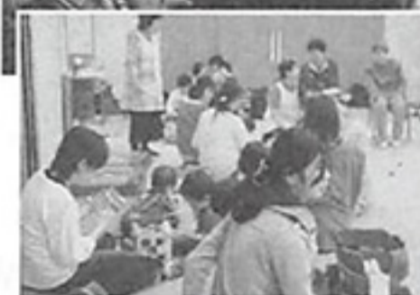
◀子育てサロン 「すなっきーず」

地区の民生委員や地域ボランティアによる小地域ネットワーク活動が活発で、見守りや日常生活の困りごとの支援(家事援助)、週1回の子育てサロンなどを展開しています。