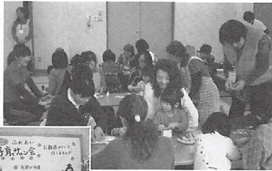
▲子育てサロン会の様子

どうやって子育てをすればよいか悩んでいる母親に、友だちづくりの場を作ってあげたいとの思いから平成14年にスタート。悩み相談や保育士・保健師からの一言アドバイスがあり、民生委員自らが寸劇も披露。楽しい仲間づくりの場となっています。