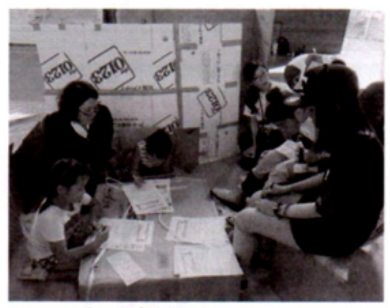
グループ発表に向けて振り返り