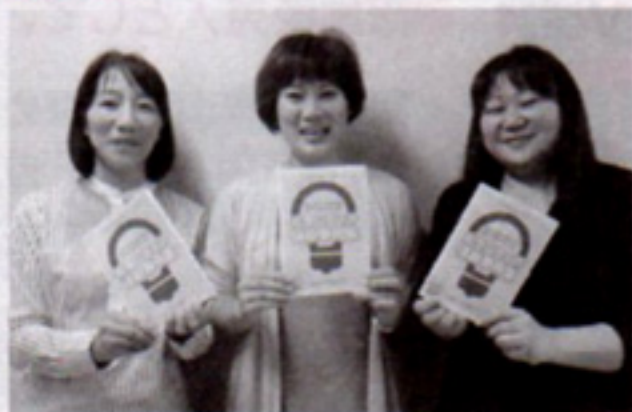
小さな冊子で手に取りやすくなりました。ぜひ、皆さんのお手元に!

府社協は、これからボランティアをはじめよう!と思っている方々に、ボランティアをより身近に感じ、興味や関心をもつきっかけづくりのために、事例集を発行しました。