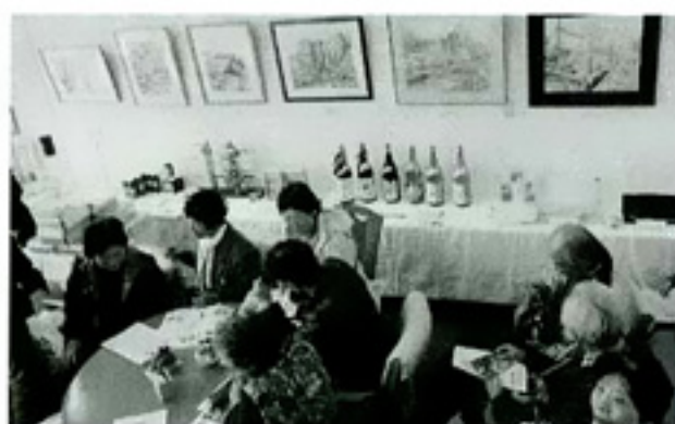
十四匠を知る展示と交流会の様子

「チョットと洒落て、憩えて、寛げる」地域の人々が気軽に立ち寄れる交流や生きがいづくりの場としてスタートした『茶の間ギャラリー(以下、ギャラリー)』は、4月で開設から丸6年。週6日の開催で、月に延べ約700人の住民が集います。 運営には25人の登録ボランティアが協力し、喫茶やバザー・展示会等の開催、地域の方から提供いただいた農園で作った有機野菜の販売も行っています。 また、多くの利用者や買物が移動や買物に関する