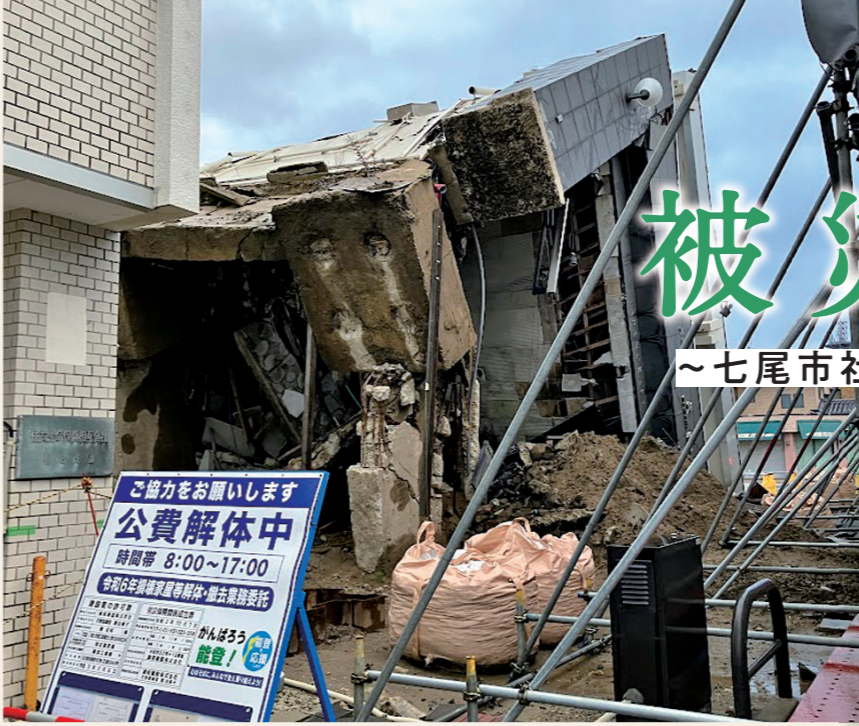
すずむ公費解体のようす(輪島市)

能登半島地震発生から1年、一歩ずつ復興が進んでいます。各地の社協では地域支え合いセンターなどが設置され、被害を受けた住民の方への相談支援・地域づくりが行われています。今回は七尾市社協と輪島市社協の職員の方に、災害ボランティアセンター（以下、災害VC）立ちあげ当時の心境やこれからの展望を伺いました。