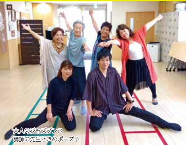
夫人のジャズダンス 講師の先生ときめポーズ♪